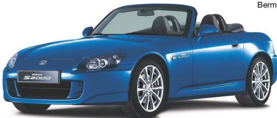
Bermuda Blue Pearl