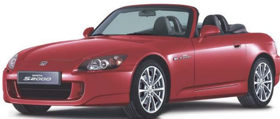
New Formula Red